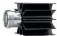
Connectique RF/HF et accessoires de test