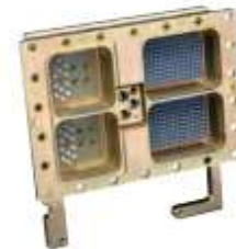
Rack & Panel Connectors